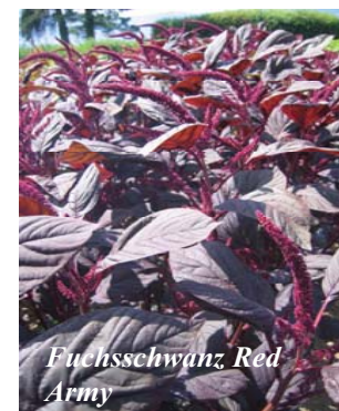
Fuchsschwanz Red Army