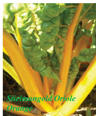
Stielmangold Oriole Orange