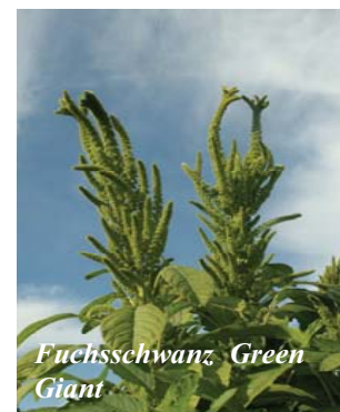
Fuchsschwanz Green Giant